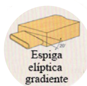
Espiga elíptica gradiente