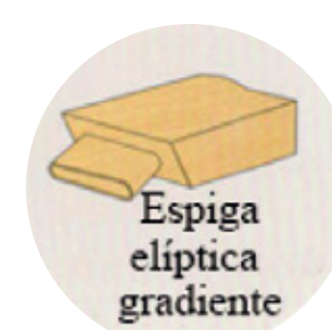
Espiga elíptica gradiente